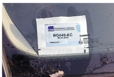
НЕИСПРАВНО! НАЛЕПНИЦА НИЈЕ СКИНУТА СА ПАПИРНОГ НОСАЧА