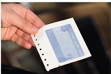
1 ИЗГЛЕД УРУЧЕНЕ НАЛЕПНИЦЕ