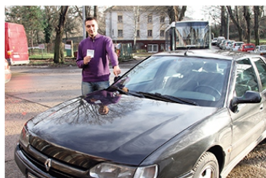
4 ПОЗИЦИОНИРАЊЕ НА ДОЊИ ДЕСНИ ДЕО ВЕТРОБРАНскоГ СТАКЛА