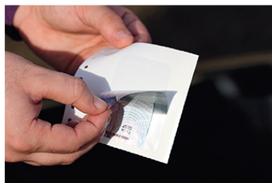
2 СКИДАЊЕ НАЛЕПНИЦЕ СА НОСАЧА НАЛЕПНИЦЕ