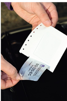
3 СКИДАЊЕ НАЛЕПНИЦЕ СА НОСАЧА НАЛЕПНИЦЕ