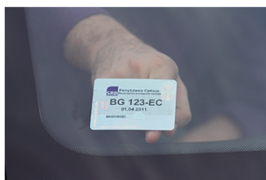
6 ПРЕЂИ ПРСТОМ ПРЕКО ЗАЛЕПЉЕНЕ НАЛЕПНИЦЕ