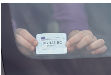
5 ПОЗИЦИОНИРАЊЕ НА ДОЊИ ДЕСНИ ДЕО ВЕТРОБРАНскоГ СТАКЛА